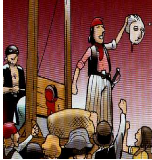
Sors F Il-qtil tar-re Lwigi XVI bil-giljottina.

Qabel ir-Rivoluzzjoni Franciża, il-poter fi Franza kien kollu f'idejn _____. Dan kien jgħix fil- _____ ta' Versailles ftit bogħod minn Parigi. In-nobbli u l- _____ kellhom pożizzjoni privileġġjata fil-pajjiż. Mill-banda l-oħra l-piż tat- _____ kien jaqa' l-aktar fuq il- _____ u fuq il-klassi tan-nofs. In- _____ kienu jgħixu fil-lussu u ma jithalltux ma' min kien inqas minnhom.