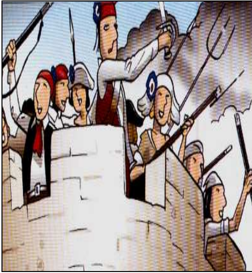
Sors E Il-waqgħa tal-Bastilja f'idejn il-poplu ta' Parigi.