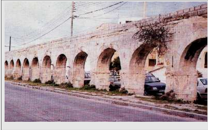
Sors C. L-Akwidott li wassal l-ilma fil-Belt Valletta