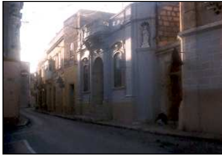
Sors F Triq f'rahal antik Malti