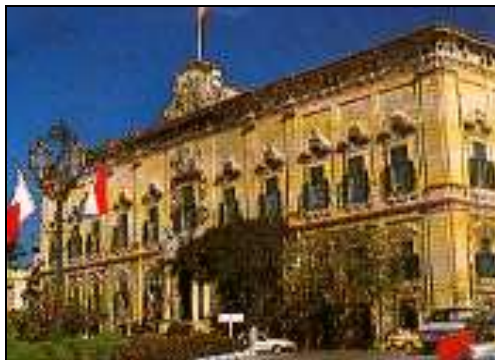
Sors B. Il-Berġa ta' Kastilja