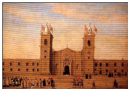
Sors E. Il-Kon-Katidral ta' San Ġwann