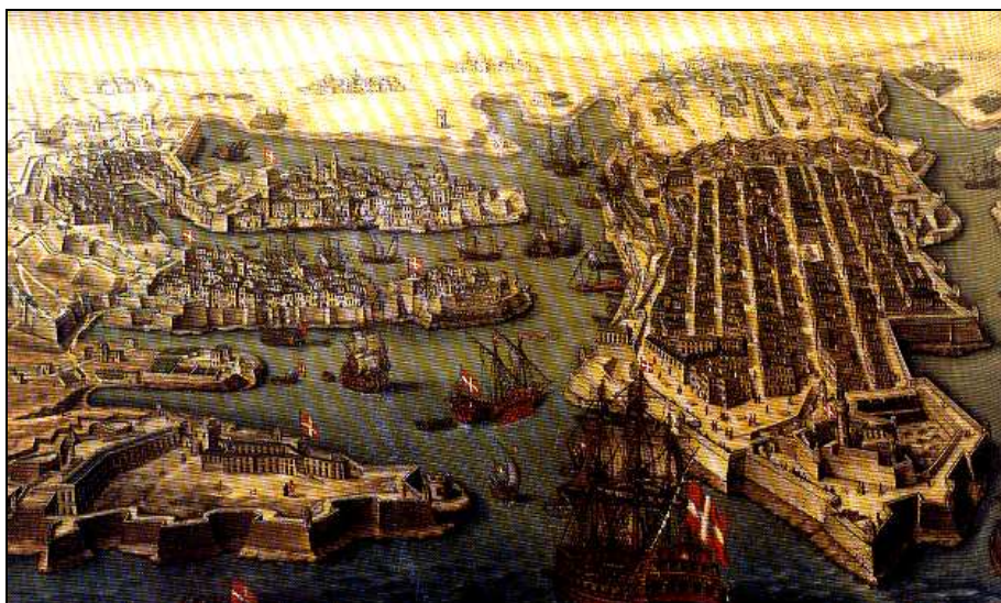
Sors A. Il-Port il-Kbir fi żmien il-Kavallieri.