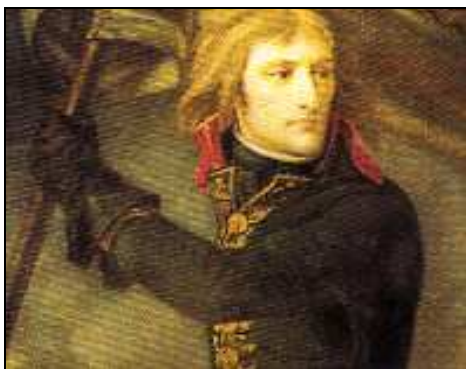
Sors H Napuljun Bonaparti

6.1 Hares sewwa lejn is-sorsi u wara wieġeb il-mistoqsijiet dwarhom.