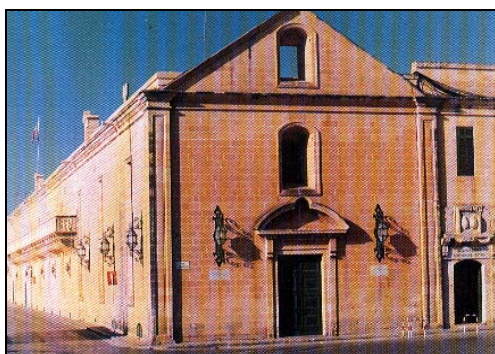
Sors D. Is-Sacra Infermeria