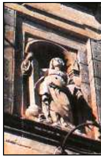
Sors Ġ Niċċa