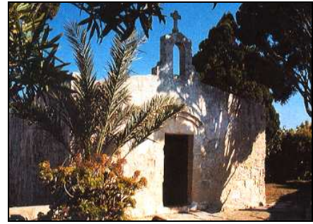
Sors G Il-Kappella ta' Ħal Millieri

4.1 Liema erba' affarijiet minn dawn issib fil-qalba tar-rahal antik Malti? Aqta' sinjal taħthom.