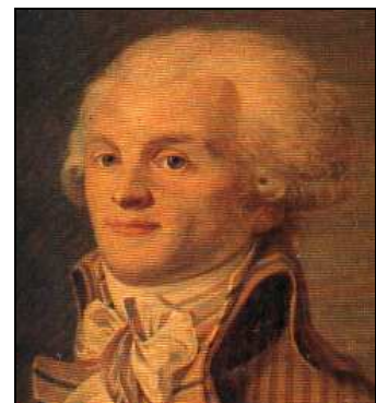
Sors J Robespierre