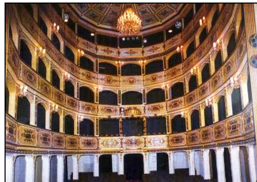
Sors Ċ. It-Teatru Manoel