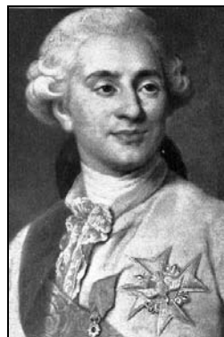
Sors I Lwigi XVI